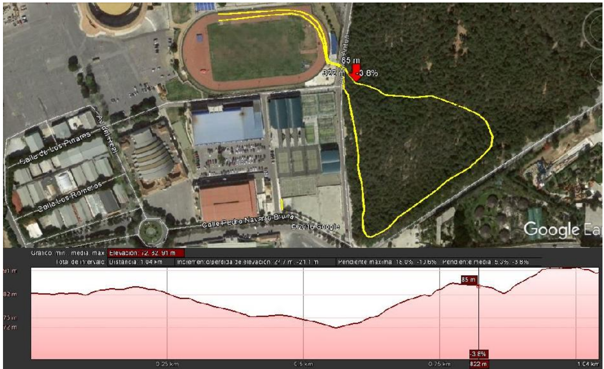
Circuito Mediano – 2450m. Salida Pista de Atletismo